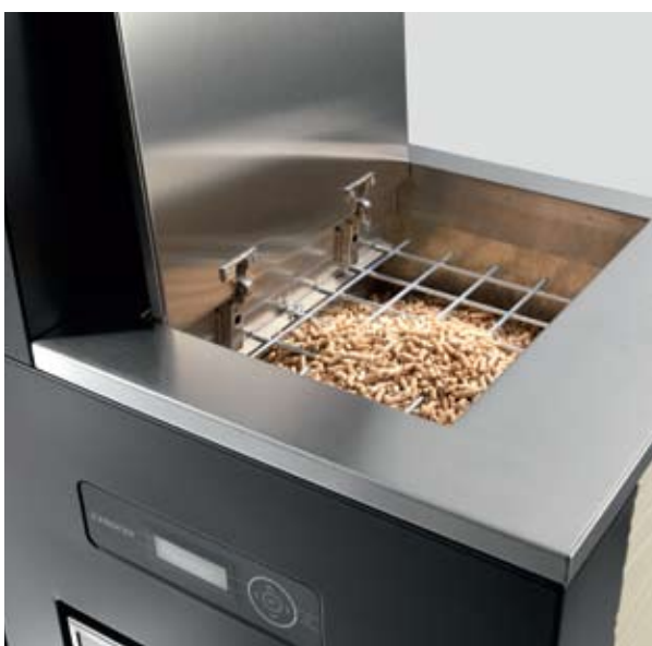
Fig.: Contenitore pellet con display di comando Aqua Insert + P