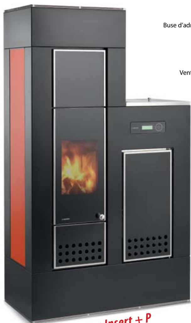
Aqua Insert + P